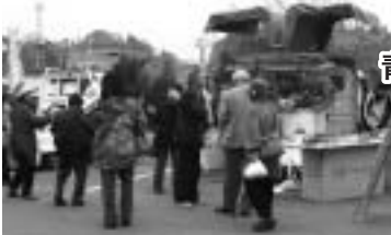
九州アルプス商工会 青年部・女性部久住支部

久住町では、久住地区商店街の外を回るバイパスが現在建設中であり、会場はたくさんの人で賑わいました。来年はじめに開通する予定です。そこで旧久住町商工会青年部・女性部では、3年前から商店街を活性化させるための調査研究やイベントを試行しており、今回が集大成的なイベントの実施となりました。これまでの「朝市」をグレードアップさせた「軽トラック市」をメインに、サブイベントとして「抽選会」「ふれあい広場」「お楽しみイベント」などを実施しました。まだ交通量が多く、商店街内での実施ができないため、「軽トラック市」を市役所久住支所前駐車場でを行い、来場者を商店街へ回遊させるため、青年部・女性部による「金魚すくい」や「だんご汁無料配布」などのイベントを商店街の駐車場で実施しました。「軽トラック市」では、野菜・加工品・果物から花・手工芸品など多種の商品が並び、人気商品は1時間で売り切れるなどとても盛況でした。