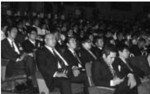
研修会での大分県席

◆会場／大分県中小企業会館 6F（大分市金池町 3-1-64） ◆お問い合わせ／地元商工会または大分県商工会連合会 TEL 097-534-9507