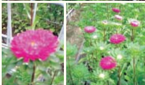
▲独自技術の確立により、年間を通じて咲き誇るマイクロアスター