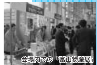
会場内での「富山物産展」