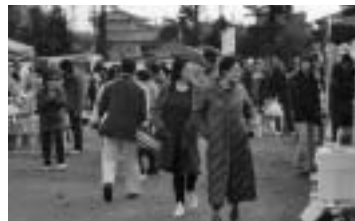
日出町商工会青年部

青年部では、毎年5月の第2土・日曜日に開催している「城下かれいまつり」で「別府湾クルージング」を実施し来場者に喜ばれています。しかし、発着場にあった「日出漁協の水産市場」が移転し放置されている状況にあるため、商工会青年部が呼びかけ、漁協青年部及び営農同志会との連携によりその活用策と催物の計画等についての検討を行いました。検討していくなかで、まずは地元農水産物等を町外へ広めていく一つの手段として、「ひじKトラ市」が企画され、第1回目を10月11日(日)、日出高校跡地において開催しました。34台が出店し、晴天にも恵まれ、数多くの来場者で賑わいました。この事業により、日出町の産物・商品の販売機会を提供し、漁業・農業・商工業従事者が「直売」することで、別府市や杵築市など近隣エリアからの集客を図り、町の知名度の向上と地域活性化を目指しています。