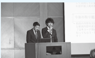
事業報告を行う発表者

今回の研修内容を、今後の地方創生プランの作成に大いに役立てていきたいと思います。