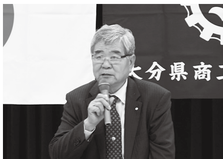
議長を務めた林会長（野津町）